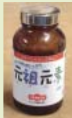
野菜の王様 アルファルファの錠剤です

カルシウム・マグネシウム・カリウム ナトリウム・リン・鉄・銅・ヨウ素・亜鉛 マンガン・ニッケル・ケイ素・スズ・チタン ルビジウム・アルミニウム・バナジウム・塩素 コバルト・鉛・モリブデン・ホウ素・硫黄