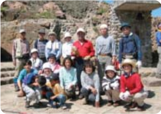
もうすぐ1つめの頂上だ! さ~みんなで頑張るぞ~