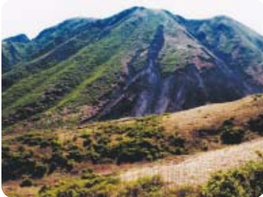
これが、三俣山。さあ~登るぞ!