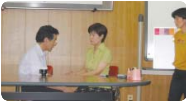
講演終了後、みなさん手相を見ていただき、和気藹々の楽しい一日を過ごしました。

しかし、これからは人間は本来の姿に戻されていきます。人間が神様と一緒に肩を並べる状態になろうとしているんですよ。つまり、人間の責任範囲(はんちゆう)が大きくなろうとしているんですよ。