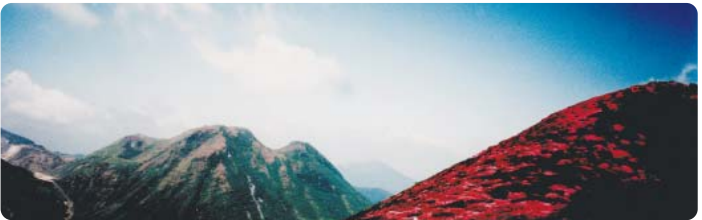
本当はこんな風景のはずだったのですが、今年は見れませんでした。残念!来年こそは、この絶景見れるかな?

頂上で昼食、天気に恵まれ360度、山に囲まれ北の高気圧、風はヒンヤリ清々しい満ち足りたひとときでした。下山して熊本県産山村(うぶやまむら)池山水源の花の温泉館で一休み。汗を流し湯を楽しむ。今日も充実した一日でした。あなたも山登りに参加してみませんか?